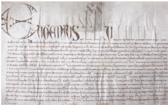
Bula del Papa Eugenio IV, concediendo al templo de El Salvador (Catedral de Oviedo) el Jubileo de la Santa Cruz, en 1438

“El perdón en Oviedo de todos sus pecados...”