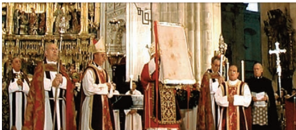
Exposición del Santo Sudario de Oviedo uno de los 3 días que se saca de la Cámara Santa para bendecir con él a los fieles que se acercan a la Catedral de Oviedo.

Cartagena, y puso en manos de S. Leandro, obispo de Sevilla –su superior y hermano– el «Arca Santa». Es bien conocido que S. Isidoro sucedió en la sede hispalense a Leandro y fue maestro de S. Ildefonso. Cuando este último fue nombrado obispo de Toledo llevó consigo a la capital del reino Hispano-Visigodo el arca de las reliquias.