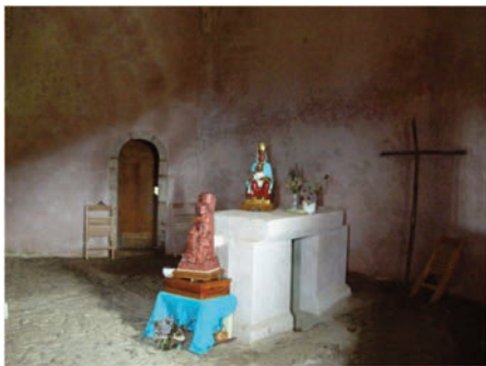
Pozo de Santo Toribio (en el hueco del altar) de la Capilla de Santiago del Monsacro, donde se custodiaron las “Santas Reliquias” que escaparon a la invasión musulmana.

Textos extraídos del libro: Montsacro “In aeternum Et in perpetuum Monte-Sacro” de la autora Natividad Torres Rodríguez