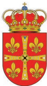
Ayuntamiento de Morcín