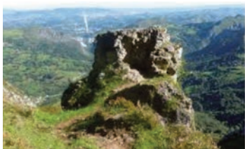
La "Silla del Obispo" en la subida al Monsacro desde Santa Eulalia.

A la presencia, pues, de las santas reliquias en la cumbre de MONSACRO, conforme a lo expuesto, se atribuye la edificación de las ermitas y el propio nombre del monte.