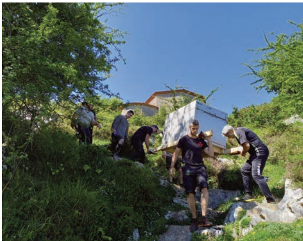
Costaleros de los Estudiantes portan a hombros, en un ensayo, una reproducción del "Arca Santa" desde la Capilla de Santiago del Monsacro hasta la Catedral de Oviedo.

Para ello la Cuadrilla de Costaleros de los Estudiantes caracterizados con trajes de la época partirán con una reproducción en madera del Arca Santa portada a hombros, en parihuela, desde el Monsacro.