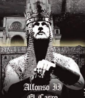
Alfonso III El Castro