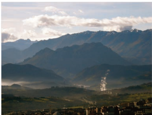
El Monsacro (en el centro de la imagen) desde Oviedo.

“...ofrece muy gratos recuerdos históricos y religiosos, porque en su cima estuvo escondida del furor de los infieles por tiempo de unos cien años, la sagrada arca de las reliquias(...). El monte en donde se conservó tan venerable depósito, tuvo el nombre de Monte Sacro, de donde vino el de Monsacro que conserva...”