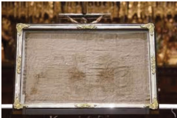
El Santo Sudario de la Catedral de Oviedo que cubrió el rostro del Señor.

Te recomendamos que te acerques a venerar la reliquia más importante de la Cristianidad junto con la Sábana Santa de Turín ( el primero se lo pusieron al Señor en la cara para bajarlo de la cruz; la Sábana Santa de Turín fue el lienzo con el que envolvieron al Señor ya en el sepulcro.