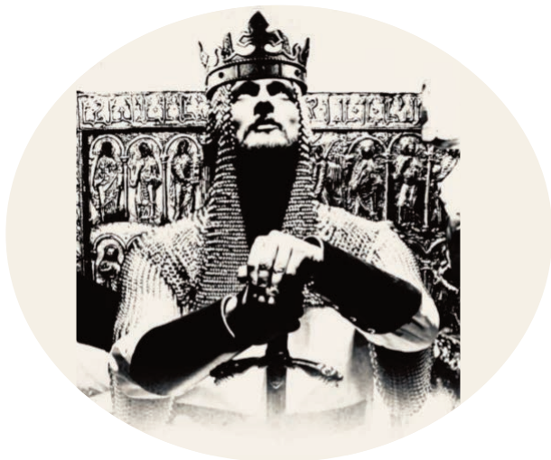
Representación del Rey Alfonso II con el Arca Santa de las Reliquias detrás.

Alfonso II el Casto, que siempre se consideró un “humilde siervo de Cristo”, mandó construir, en el siglo IX, la llamada Cámara Santa.